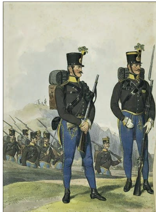
Српски граничари Аустријске царевине