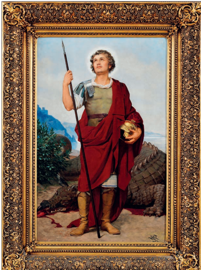
Урош Предић, Свети Георгије, 1902.

Умро је 1953. године у Београду, у 96. години, као најстарији српски сликар. Према сопственој жељи сахрањен је у родном месту.