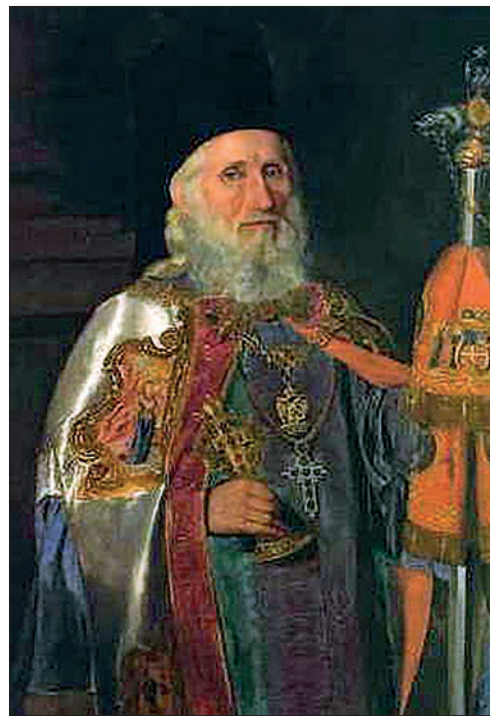
Патријарх Јосиф Рајачић