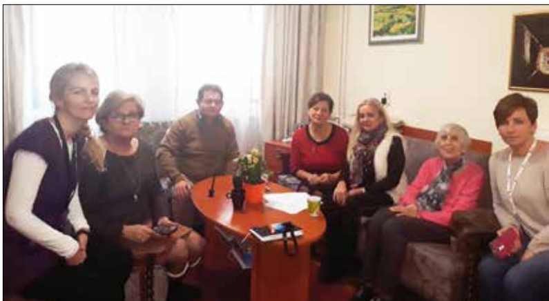
Чланови Самоуправе са пријатељима