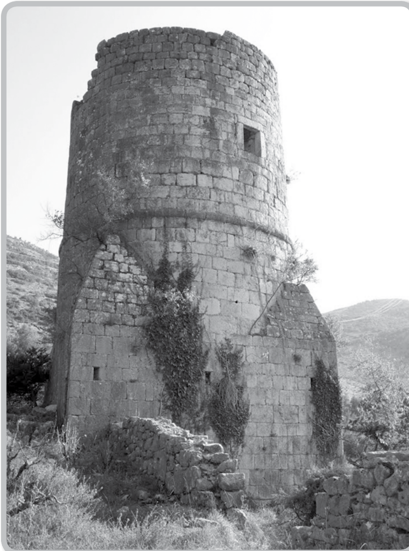
Кула Бранковића код Требиња

Почетком XII века кад је на Балкану почела да расте моћ српских владара, долазило је до разних политичких бракова између српске феудалне аристократије и ромејских принцеза. Син жупана Немање и први српски општепризнати краљ Стефан Првовенчани узео је за же-