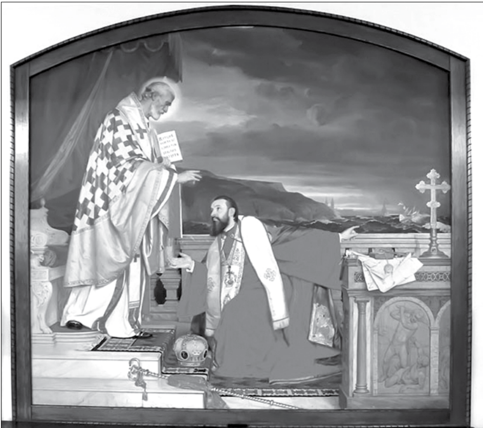
Платно на којем је представљен патријарх Лукијан чува се у Патријаршији СПЦ-а