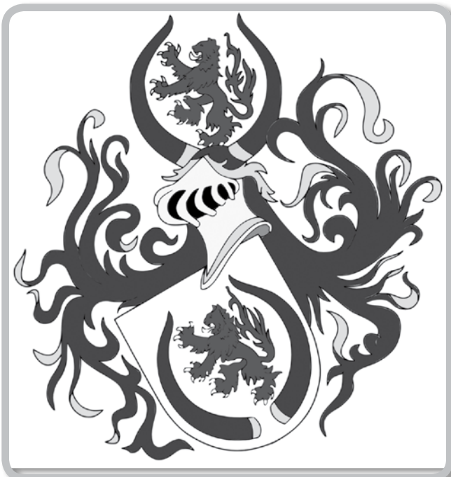
Грб породице Бранковић

Мара Бранковић управљала је породичним поседима, водила државне послове и имала свој печат да њиме оверава повеље и мировне уговоре. Када је њен син Ђурађ био код куће, на документима су се заједно потписивали, а њихов печат с ликом лава у ходу био је направљен по угледу на Немањиће