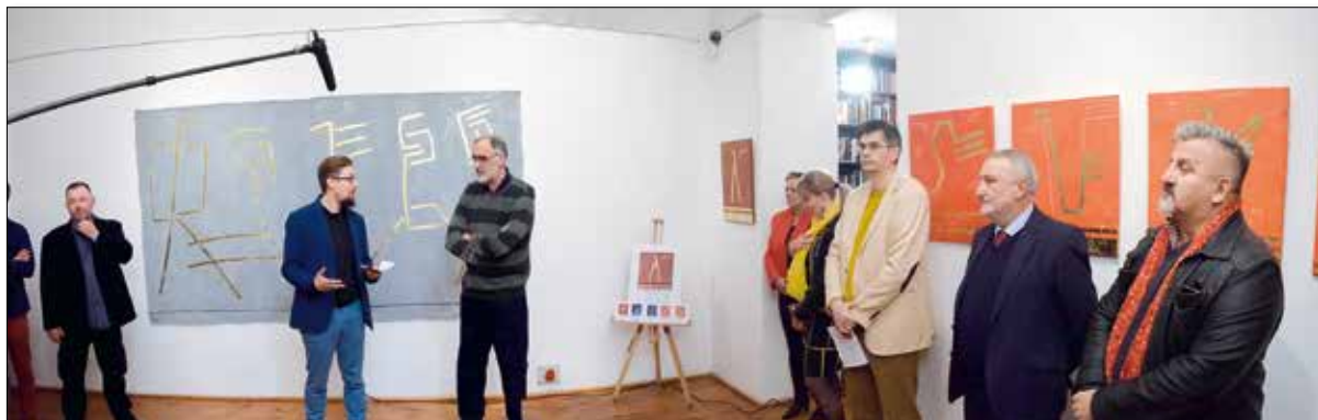
Изложба и вече сатире у Српском културном центру

Радња филма дешава се у Београду 2004. године. Црни Зуб (Која) креће у акцију и потрагу за квалитетним