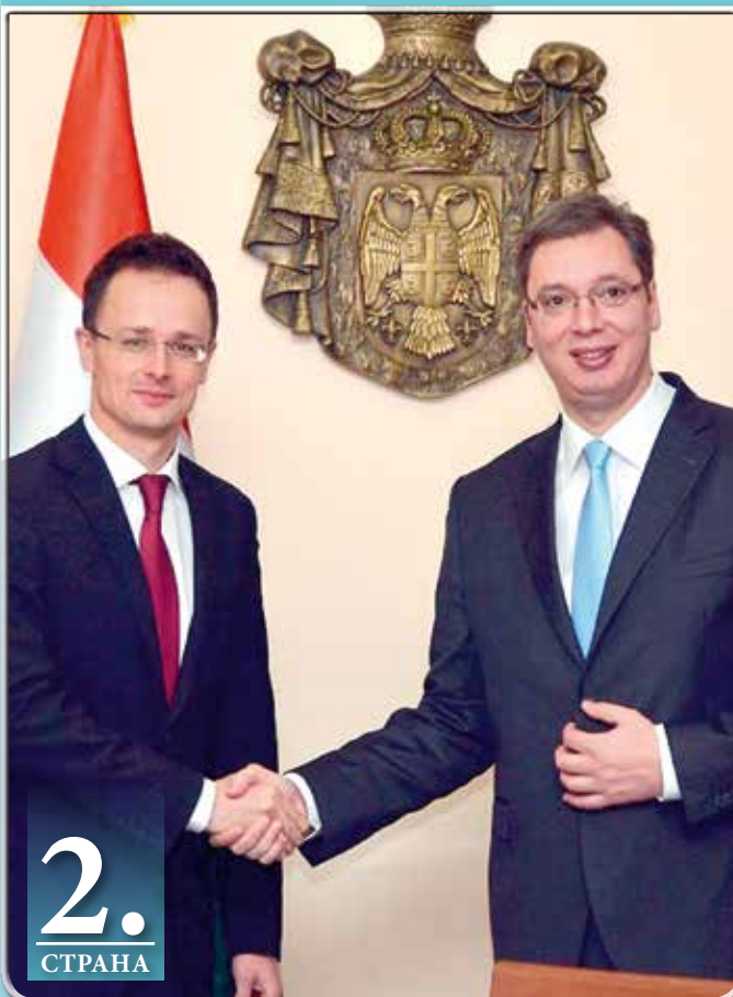
Сијарто посетио Београд