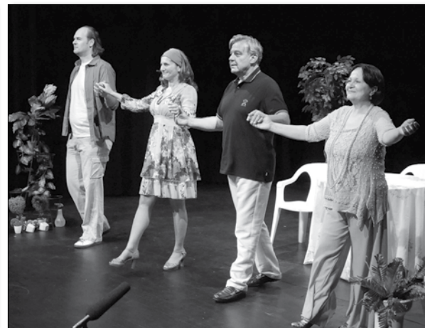
Глумци из Београда на сцени у Будимпешти