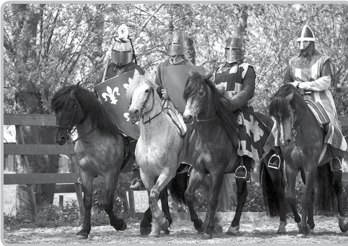
Изглед српских средњовековних витезова

Пошто је велика турска војска, тог пролећа на путу за Косово, прелазила преко Дејановића територија са хиљадама јаничара и припадника лаке јуришне коњице у строју и стотинама камила у њиховој комори, Велбужани су могли да виде каква је то војна сила, а Јеленин отац Константин морао је да у свом