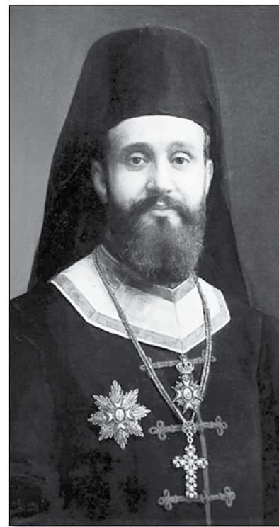
Патријарх Лукијан Богдановић

Лукијан никада није дочекао да уведе брод српске цркве „у оно тихо пристаниште, у којем нема ни буре,