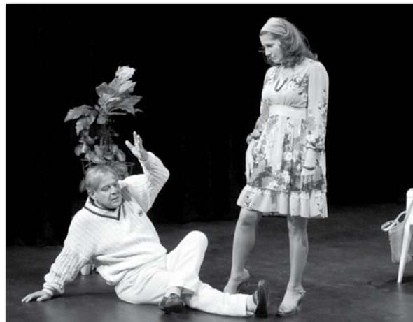
Детаљ из представе „Погрешан број“

У питању је комедија забуне, у којој јунаци овог комада покушавају да се ишчупају из паучине грешака које су сами исплели. Погрешан број, погрешан дан или човек, погрешна тема или живот. Све је могуће, а решавајући проблеме, ликови у оком комаду се у њих све више увлаче. Улоге у овој