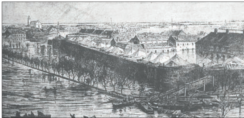
Сегединска тврђава на обали Тисе