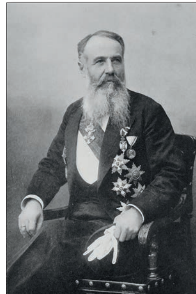
Српски државник Никола Пашић рођен је 31. децембра 1845.

4. јануара 1494 – Штампарија у Цетињу штампала је прву књигу на српском језику – „Октоих првоглавник“ Ђурђа Црнојевића и штампара Макарија, једну од највише коришћених богослужбених књига у Српској православној цркви.